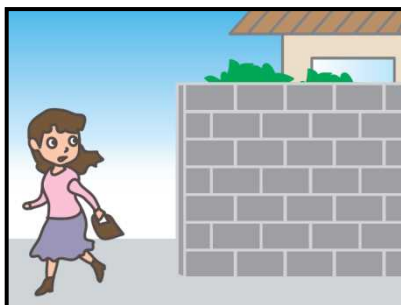
危ない場所から離れて！