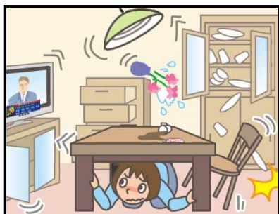
頭を守って、安全な場所に避難！

緊急地震速報を見聞きしたときの行動は、まわりの人に声をかけながら「周囲の状況に応じて、あわてずに、まず身の安全を確保する」ことが基本です。